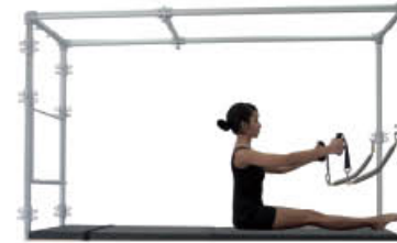
1. Inspire. Mantenga la posición de inicio