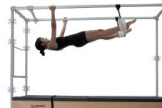
5. Inspire. Alinee