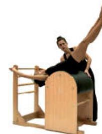
5. Inspire. Cambie el cruce