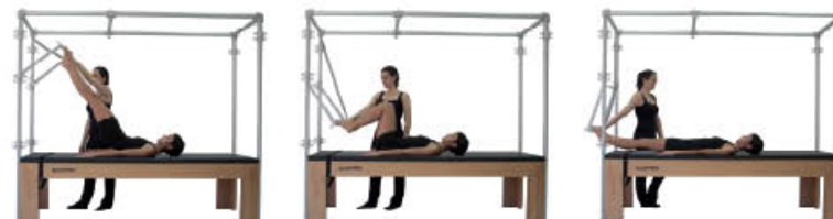
10. Inspire. Comience a rodar abajo 11. Espire. Flexione rodillas 12. Espire. Posición Inicial