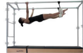
2. Espire. Extienda caderas y alinee