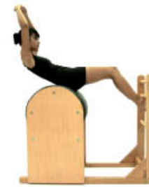
5. Inspire. Vuelva al centro