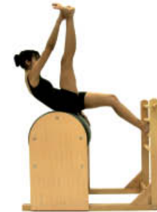
3. Inspire. Cambie la mano de agarre