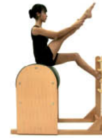
2. Espire. Extienda rodilla