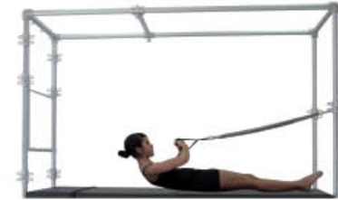
2. Espire. Ruede la columna y flexione codos