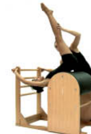
6. Espire. Ruede atrás