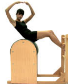
4. Espire. Rote la columna