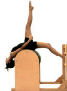
4. Inspire. Acóplase al barril