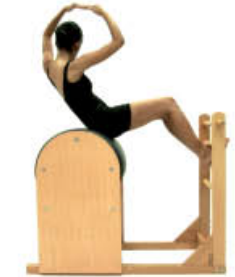
6. Espire. Rote al otro lado