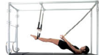
4. Espire. Extensión de hombros