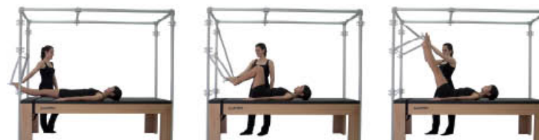
1. Inspire. Mantenga la posición de inicio 2. Espire. Posición de tablero 3. Inspire. Extensión de rodillas