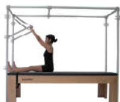
11. Inspire. Vuelva a posición de inicio