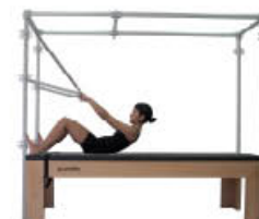
9. Inspire. Vuelva a posición de inicio