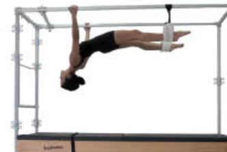
3. Espire. Extienda la columna y flexione codos