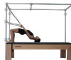
4. Inspire. Extienda caderas