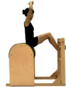
1. Inspire. Mantenga posición de inicio