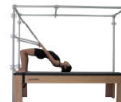
6. Inspire. Vuelva a posición de inicio