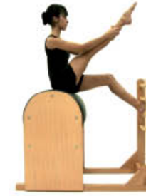
2. Espire. Extienda rodilla. Inspire