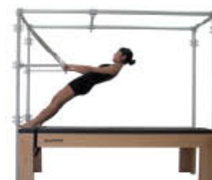
7. Inspire. Vuelva a posición de inicio