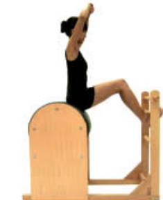
9. Inspire. Posición inicial