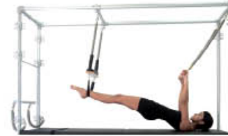
3. Inspire. Mantenga alineación