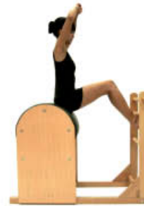
1. Inspire. Posición Inicial