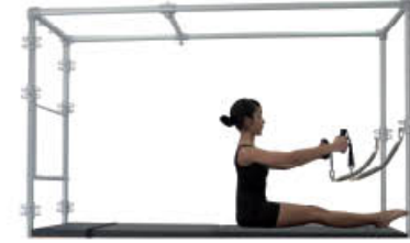
6. Inspire. Posición de inicio