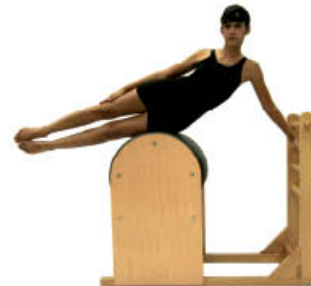
2. Espire. Extienda el codo