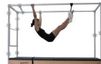
1. Inspire. Vuelva a la posición de inicio