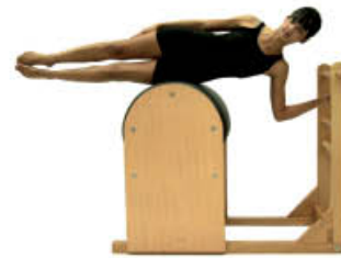
1. Inspire. Mantenga posición de inicio