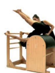
7. Inspire. Vuelva al centro