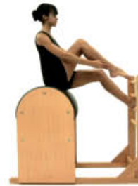
1. Inspire. Posición Inicial