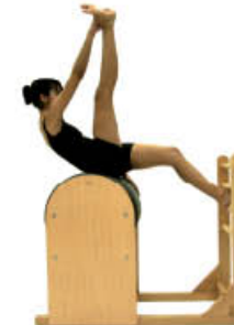
5. Espire. Ruede arriba