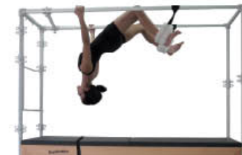
4. Espire. Flexión de rodillas