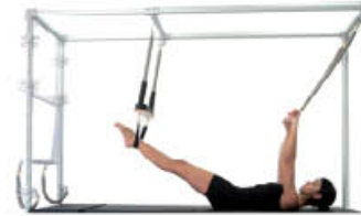
1. Inspire. Mantenga la posición de inicio