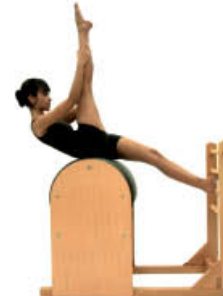
7. Espire. Ruede