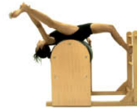
4. Espire. Ruede. Aquí inspire