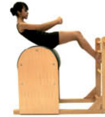
2. Espire. Ruede