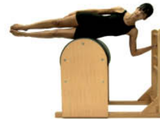
3. Inspire. Posición de inicio