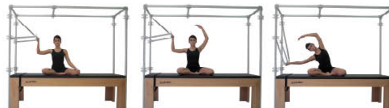
1. Mantenga la posición de inicio