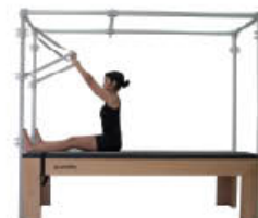
1. Mantenga la posición de inicio