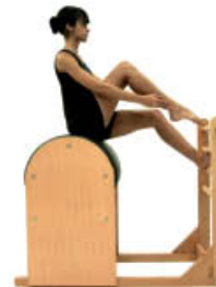
7. Inspire. Flexione la rodilla