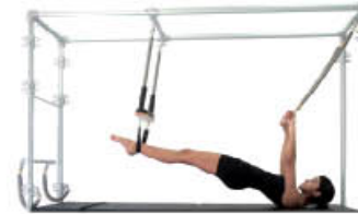
5. Inspire. Brazos a la vertical