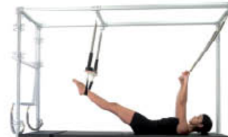
7. Espire. Posición inicial