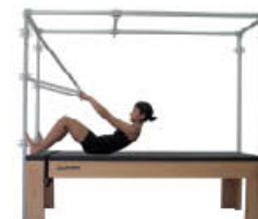
3. Espire. Flexión de rodillas