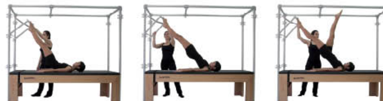
4. Espire. Comience a rodar columna 5. Inspire. Ruede hasta la alineación 6. Espire. Flexione cadera