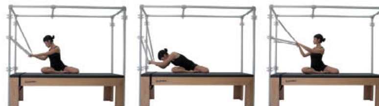
4. Inspire. Agarre la barra