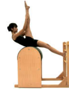
3. Espire. Ruede