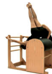
3. Inspire. Cruce piernas