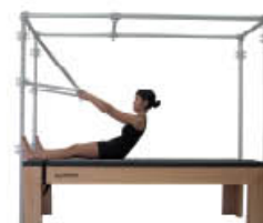
10. Inspire. Vuelva a posición de inicio