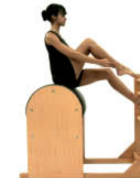
8. Inspire. Posición inicial