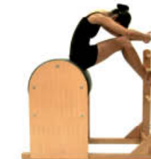
8. Espire. Ruede delante