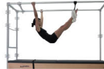
1. Inspire. Mantenga la posición de inicio

Transverso del abdomen que comprime el abdomen y estabiliza la región lumbo-pélvica. Fibras profundas del suelo pélvico en sinergia con el transverso. Estabilizadores de escápula durante todo el ejercicio. Los oblicuos también trabajan para prevenir la hiperextensión de la columna lumbar. El glúteo y los isquiotibiales, extienden la cadera y flexionan las rodillas en concéntrico. Los músculos del antebrazo para estabilizar la muñeca y la mano. Los erectores de columna la extienden concéntricamente.