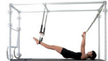
6. Espire. Rueda la columna a posición inicial