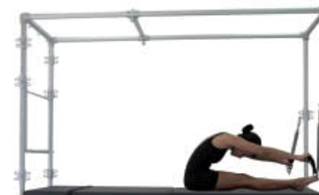
5. Inspire. Aducción horizontal