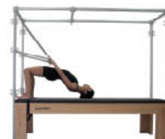
8. Inspire. Vuelva a posición de inicio