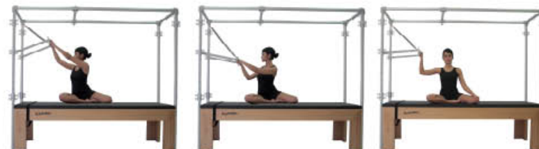
7. Espire. Flexión de hombros