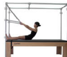
2. Inspire. Ruede columna