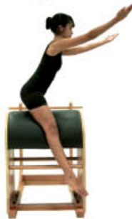
2. Espire. Aduca las piernas