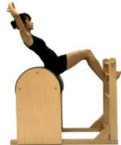
2. Espire. Déjese caer. Aquí inspire