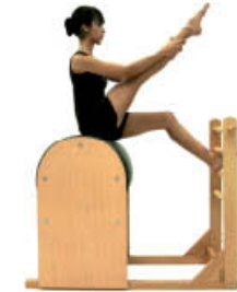
6. Espire. Llegue arriba