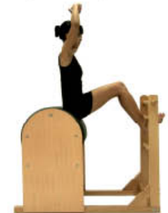
3. Espire. Vuelva a la posición de inicio