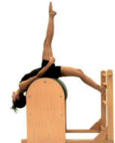
6. Espire. Agarre el muslo