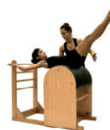
Espire. Posición inicial