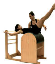
4. Espire. Descienda columna