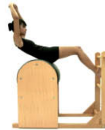
7. Inspire. Vuelva al centro