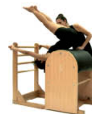
2. Espire. Ruede atrás