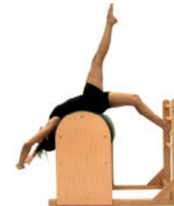
5. Inspire. Suelta manos