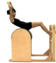
3. Inspire. Eleve brazos