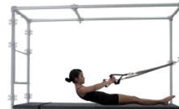
3. Inspire. Flexione codos y rote hombros