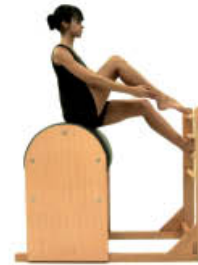
1. Inspire. Posición Inicial