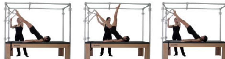
7. Inspire. Vuelva a la alineación 8. Espire. Flexione la otra cadera 9. Inspire. Vuelva a la alineación